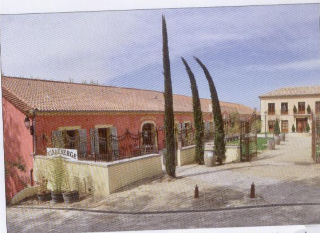
Weintourismus für Profis: Links der »Arbeitsplatz«, rechts hinten das Hotel mit Apartments der »Weinherberge«

Das von der Straße aus wie ein gepflegtes Château wirkende Zentrum entstand auf dem Gelände der ehemaligen Kooperative von Poilhes in reizvoller Umgebung des Weltkulturerbes Canal du Midi. Das Anwesen verfügt über Präsentations- und Verkostungsräu-